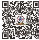
原住民族教育發展處