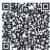
2026 地域振興大賞售票系統

https://www.placesmaking.com/the6thplacemakingprizeregulationsform