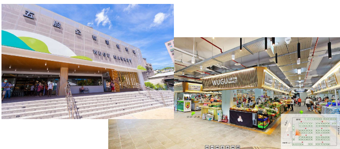
五股公有零售市場 五股區工商路3號