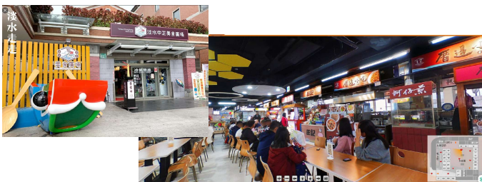
淡水中正美食廣場 淡水區中正路115號